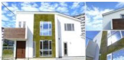
特化した壁面苔緑化