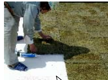
「モスフラット」施工中