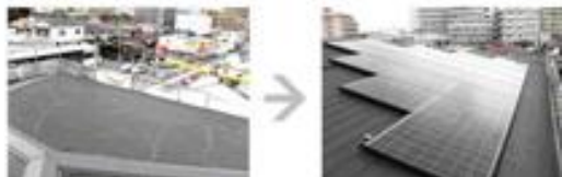
ソーラーと併用する苔緑化