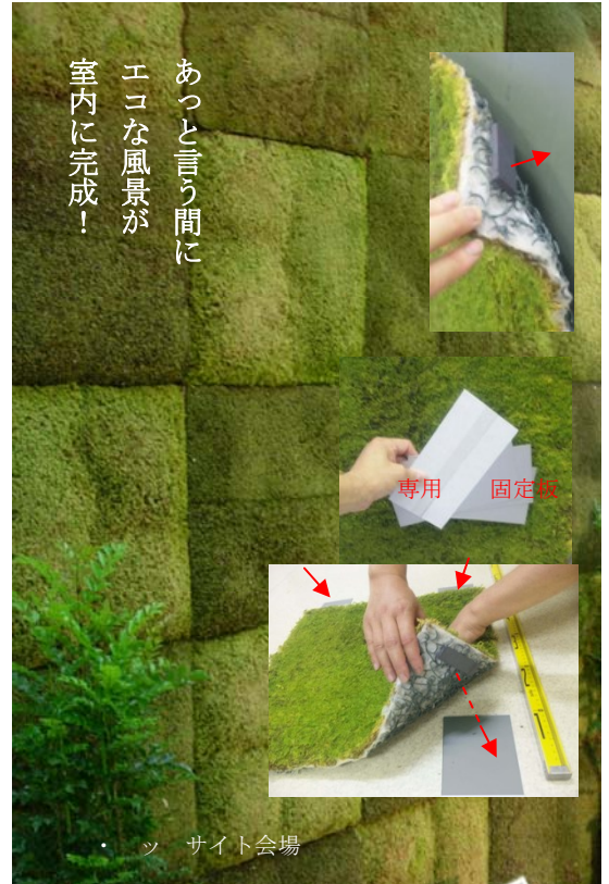
モスフェース 部材 専用固定板

http://www.moss-net.jp http://www.moss-net.jp/html/in_form.htm